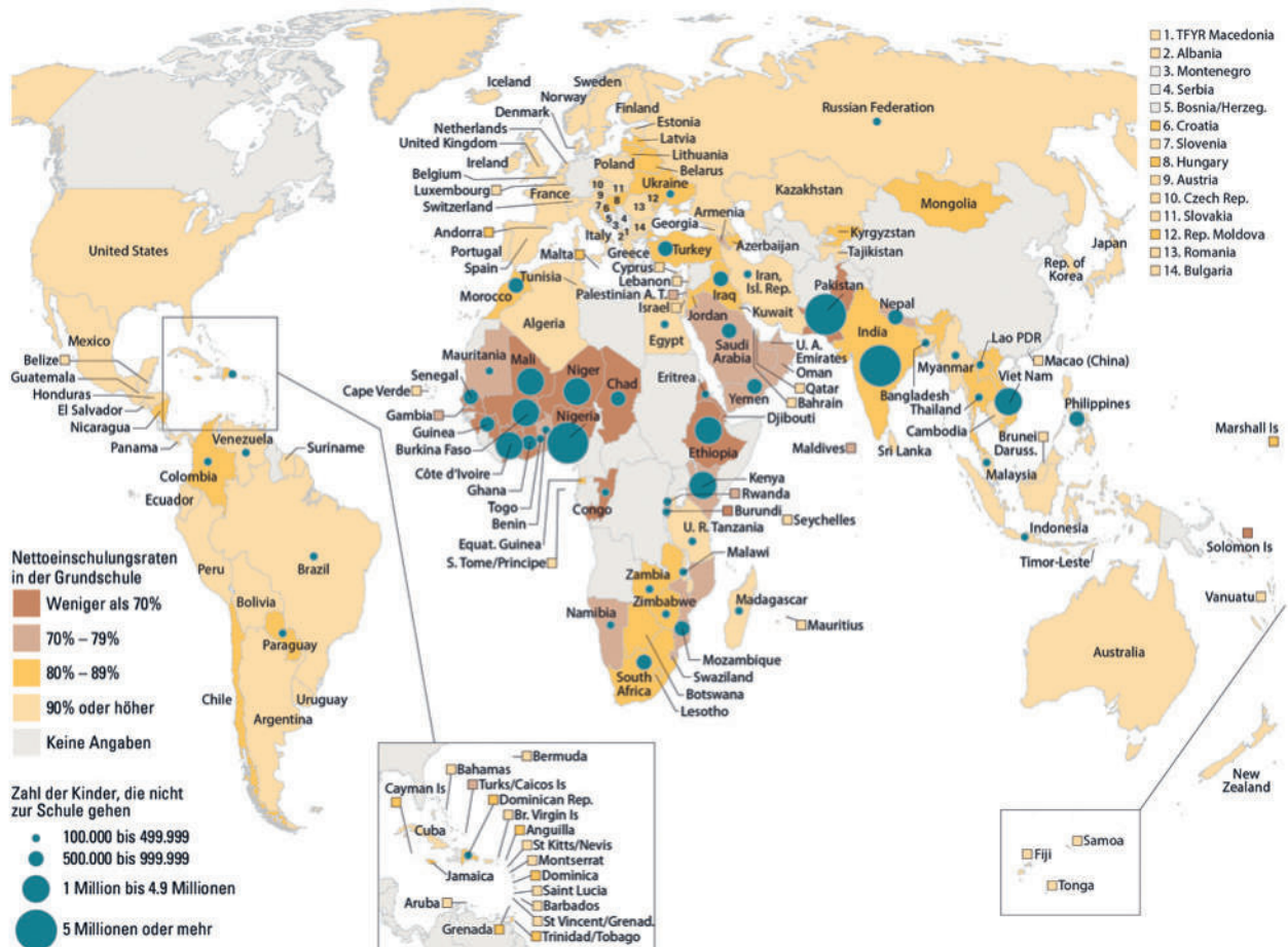
Abbildung 2: Zahl der Kinder, die nicht zur Schule gehen, und Nettoeinschulungsraten, 2005