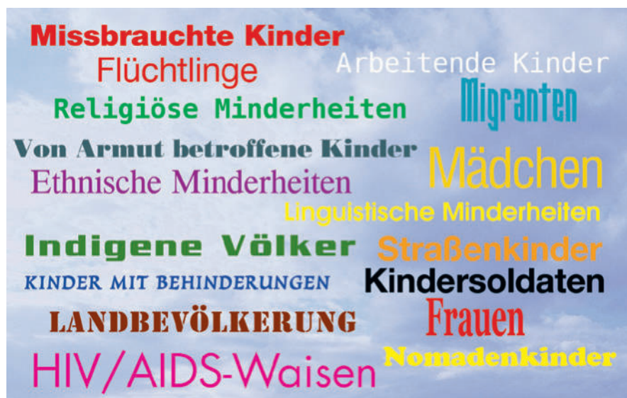
Abbildung 1: Beispiele für Gruppen, die im Bildungsbereich ausgeschlossen oder marginalisiert sind

In einer zunehmend globalisierten Welt, in der die 85 wohlhabendsten Personen über so viel Vermögen verfügen wie die unteren 50% der Weltbevölkerung 2 und rund 1,2 Milliarden Menschen unterhalb der extremen Armutsgrenze von weniger als 1,25 US-Dollar pro Tag leben 3 , ist „Armut eine Bedrohung für den Frieden“ (Yunus, 2006) 4 . Armut und andere Faktoren, die zu gesellschaftlicher Exklusion beitragen, beeinträchtigen individuelle Bildungschancen erheblich. Limitierte Bildungschancen wiederum beeinträchtigen die Chancen von Individuen, der Armut zu entkommen. Der UNESCO-Weltbildungsbericht 2013/2014 (UNESCO, United Nations Educational, Scientific and Cultural Organization) unterstreicht, dass wenn in Ländern mit niedrigem Einkommen alle Schüler die Schule mit Grundkenntnissen im Lesen verließen, 171 Millionen Menschen der Armut entkommen könnten. 5 Dies entspricht einer Reduzierung der weltweiten Armut um 12%. Global gesehen steigert ein Jahr Schule die individuellen Einkünfte um durchschnittlich 10%. Doch Bildung unterstützt nicht nur den Einzelnen, sie generiert auch Produktivität und fördert somit das Wirtschaftswachstum. Eine Steigerung des durchschnittlichen Bildungserwerbs der Bevölkerung eines Landes um ein Jahr lässt das jährliche Pro-Kopf-BIP (BIP, Bruttoinlandsprodukt) von 2% auf 2,5% wachsen. 6